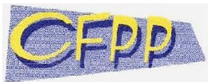
Centro de Formação de Professores de Portimão